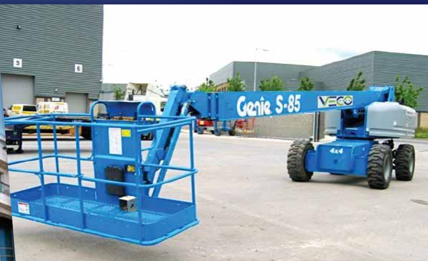
DIAGRAMA DE TRABAJO S-85